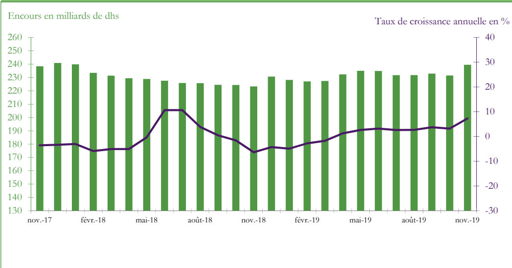
Graphique 4 : VARIATION DU CREDIT BANCAIRE PAR OBJET ECONOMIQUE (en glissement annuel, en%)